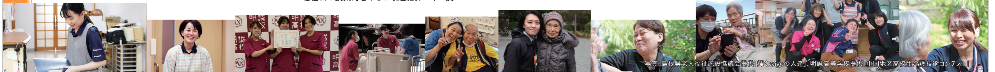
写真:島根県老人福祉施設協議会提供「輝くKaigoの人達」、明誠高等学校提供「中国地区高校生介護技術コンテスト」